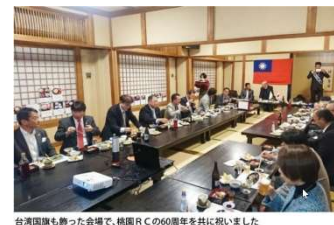
台湾国旗も飾った会場で、桃園 RC の 60 周年を共に祝いました

幸手 RC では、毎年桃園 RC を訪れ、式典に参加しているそうです。コロナ禍の影響で、今回は蕎麦屋の宴会場にプロジェクターを持ち込み式典の様子を見ながらオンラインで式典に参加の様子です。