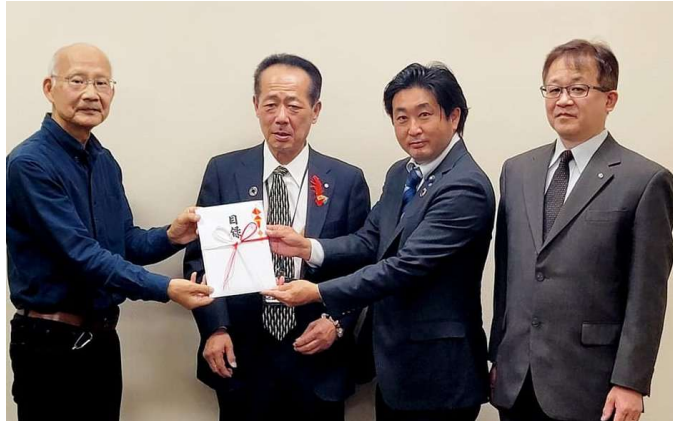
杉戸ロータリークラブ Facebook より

杉戸町広報誌 11月号に、地区補助金事業(ワクチン接種会場に備品を寄贈 9/29)が掲載されています。