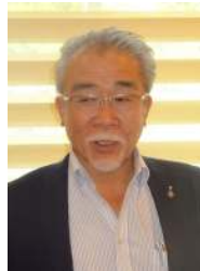
仁部会長 仁部会長