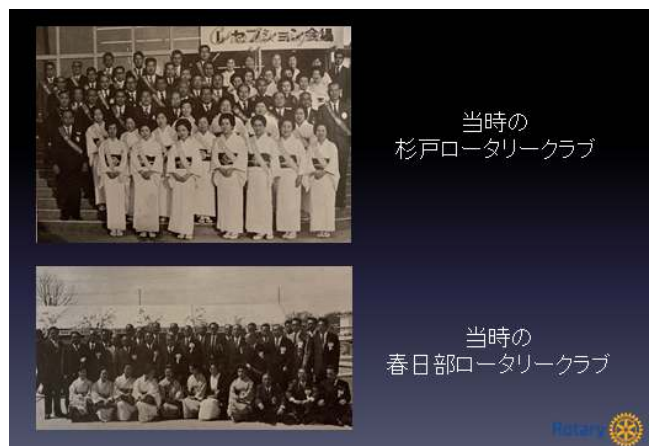
当時の 杉戸ロータリークラブ