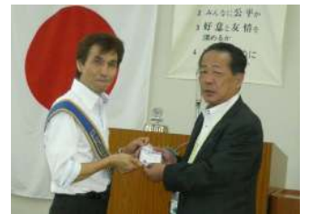
新入会員2名紹介者表彰