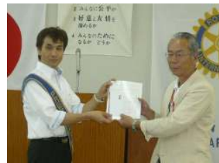
アグリパーク花火協賛金